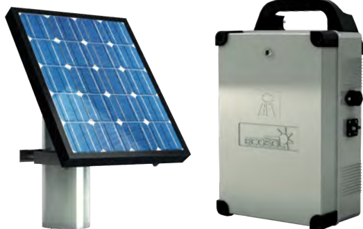
Panneau solaire et batterie