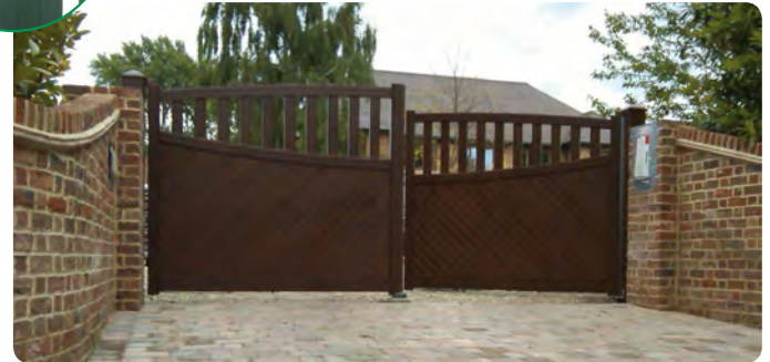
Moteur adaptable sur portail ton bois

Nouveauté 2011 Déverrouillage avec clé intérieur / extérieur