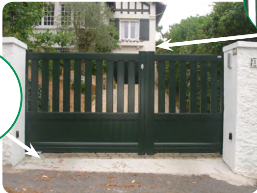
Batterie de secours intégrée d'office