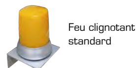
Feu clignotant standard